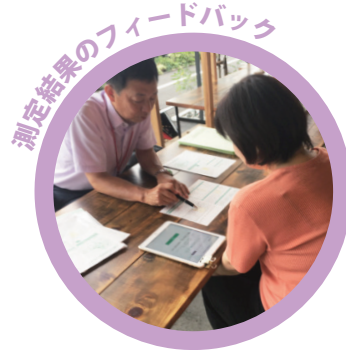
測定結果のフィードバック