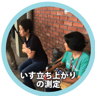
いす立ち上がりの測定