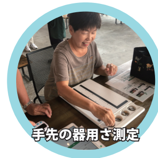
手先の器用さ測定